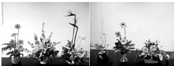
图2 学生插花作品互评

传统的课程评价体制是期末考试成绩加实验课成绩,其中期末成绩占总成绩的70%,实验课占30%,实验课成绩来自实验报告的考核。这种测评方法忽略了实践动手能力的考核,不能客观准确地反映学生对插花实践技能的掌握情况,也不能充分调动学生动手操作的积极性。为了更好地理论联系实际,充分提高学生的动手能力,笔者改革和完善了成绩评价体制,将原来理论和实践考核的比例由原来的7:3改为1:1,即理论考试占50%,实践动手能力考核占50%。其中实践动手能力的成绩在实验课上结合插花作品当场评出,学生作品完成后(图2),把所有作品放在一起,结合评比规则(表2),同学之间互相观摩并提出意见,然后进行互评,最后由老师进行总结并点评,作品的不足之处当场即得到纠正,能够取得举一反三、事半功倍的效果。