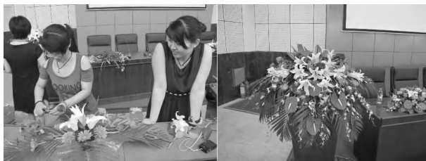
图3 组织同学参加会议室插花设计

在校内进行插花比赛和表演,可激发学生的创作热情 and 创新能力,丰富学生业余文化生活,培养审美能力,提高他们的精神文明素质。插花是一项高雅的修身养性的艺术活动,综合美学、绘画、书法等艺术领域的特点,需要各方面理论知识的综合运用。鼓励学生积极参与学校的重要庆典活动,如会议室插花设计(图3)、新年联欢晚会花艺展示等,使学生们在实践中不断进步和提高。通过比赛、表演,不但可以更好地将理论用于实践,提高实际动手操作能力,还可以在全校范围内向学生们宣传普及插花基本知识,提高大学生的审美意识和审美情趣,让更多大学生更好地了解插花艺术的美妙意境,总体提高学生的精神文明素质。